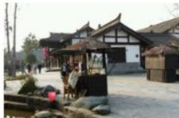
大营村建筑外貌改造示意